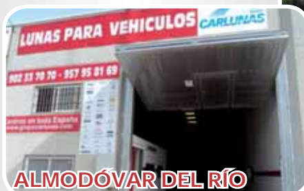
ALMODÓVAR DEL RÍO